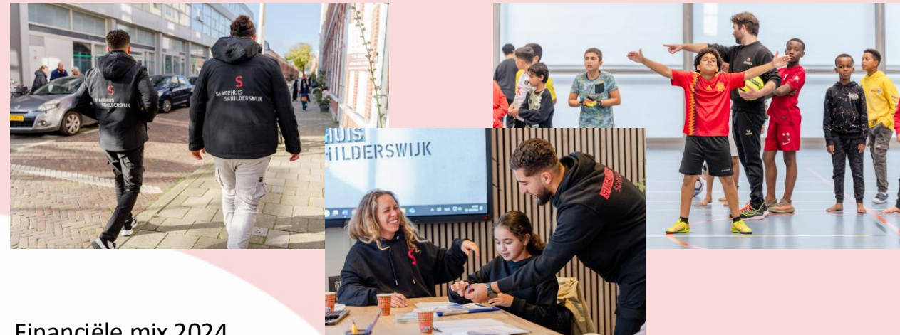
Financiële mix 2024